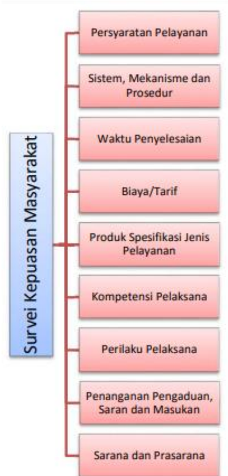
Gambar 1. Model Konseptual Unsur Pelayanan Survei Kepuasan Masyarakat

Adalah segala sesuatu yang dapat dipakai sebagai alat dalam mencapai maksud dan tujuan. Prasarana adalah segala sesuatu yang merupakan penunjang utama terselenggaranya suatu proses (usaha, pembangunan, proyek). Sarana yang digunakan untuk benda yang bergerak (komputer, mesin) dan prasarana untuk benda yang tidak bergerak (gedung).